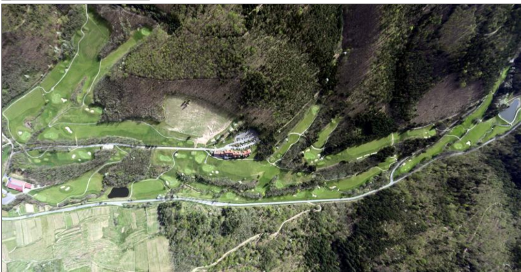
À flan de colline, le parcours du golf d'Ammerschwihr est d'un vert flamboyant.