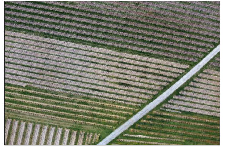
Le vignoble de la Hart offre un aspect particulièrement graphique à la verticale.