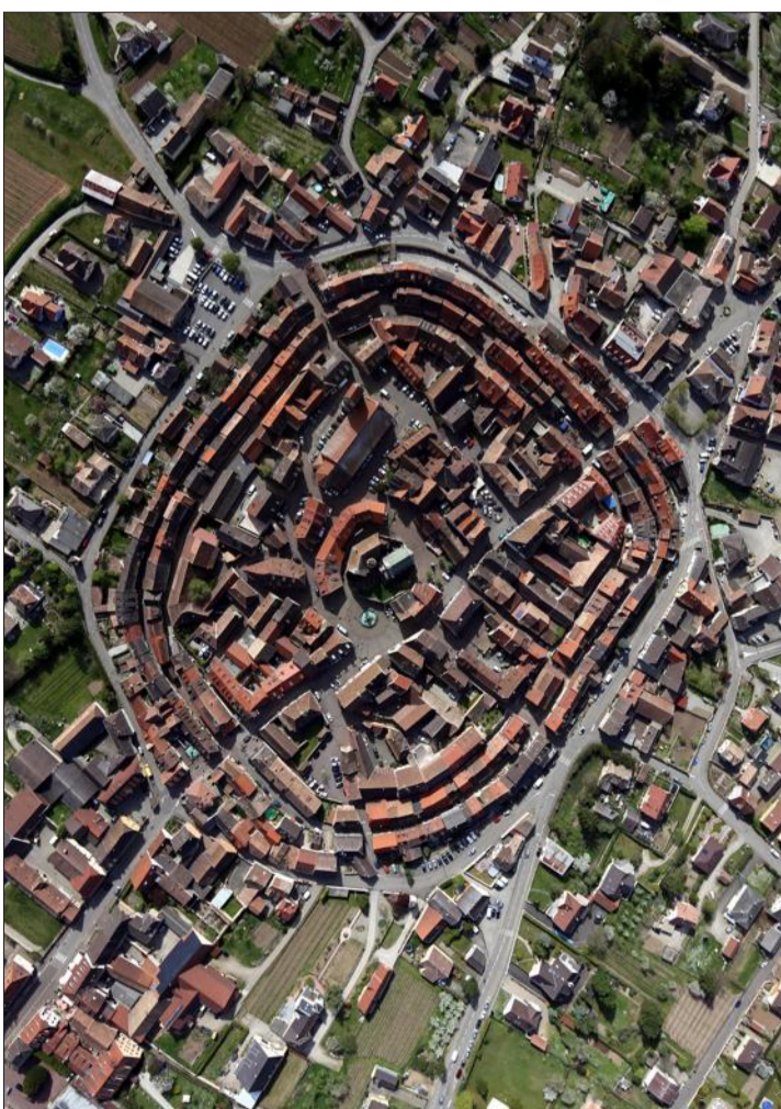
Cernée par ses remparts médiévaux, Éguisheim est reconnaissable entre toutes.