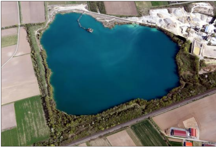
Une gravière en forme de cœur vue du ciel.