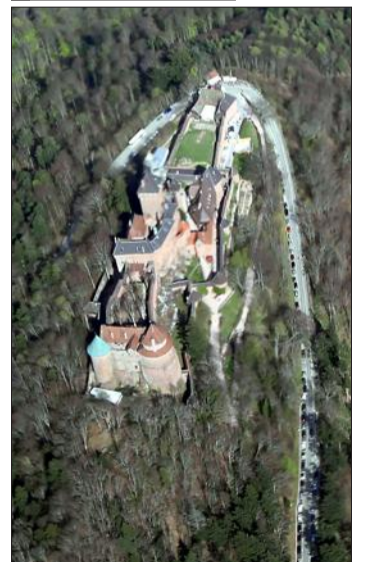
Le château du Haut-Koenigsbourg.