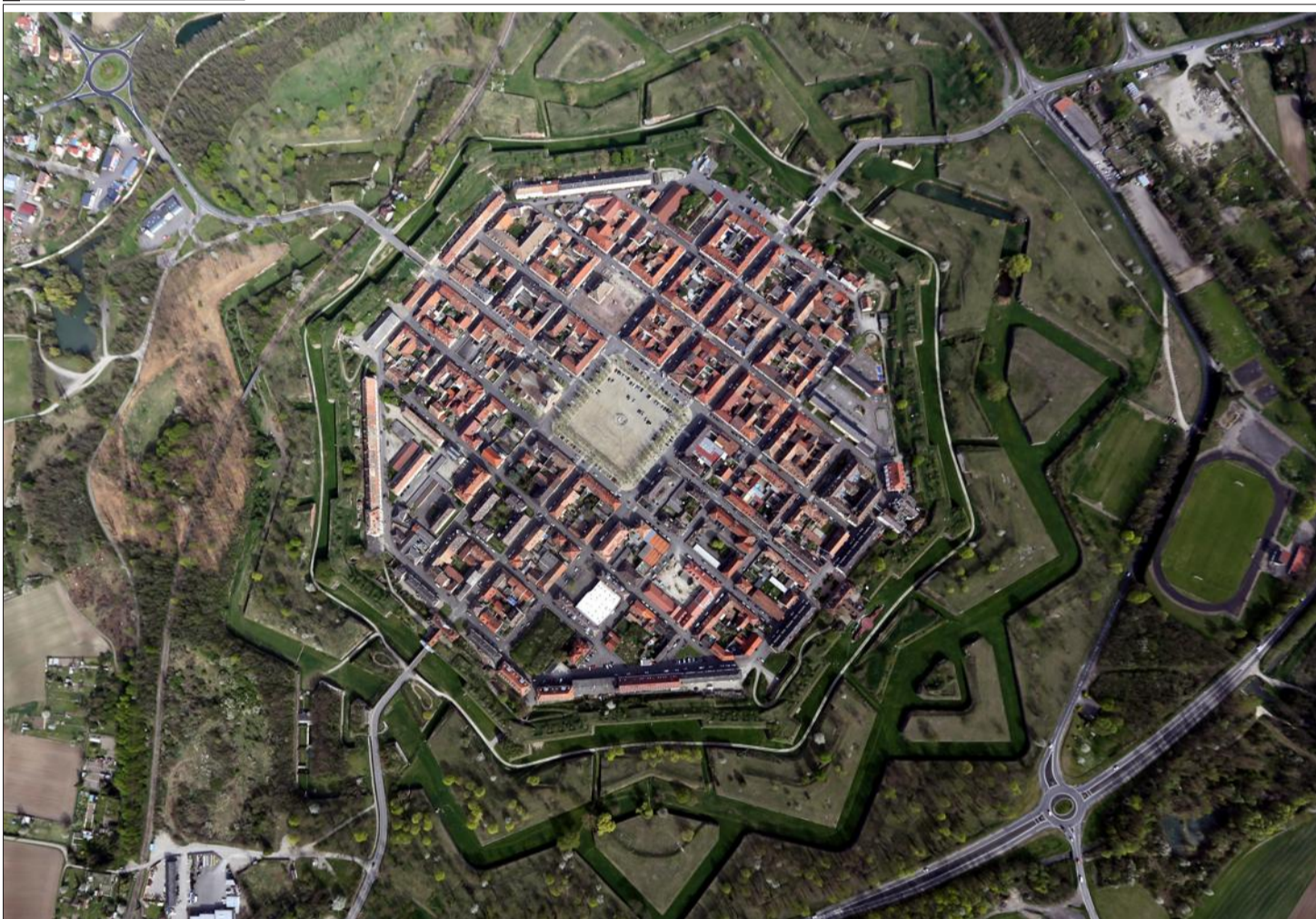
Un point de vue sur Neuf-Brisach, inscrit sur la liste du patrimoine mondial de l'Unesco, qui aurait sûrement plu à Vauban son architecte.