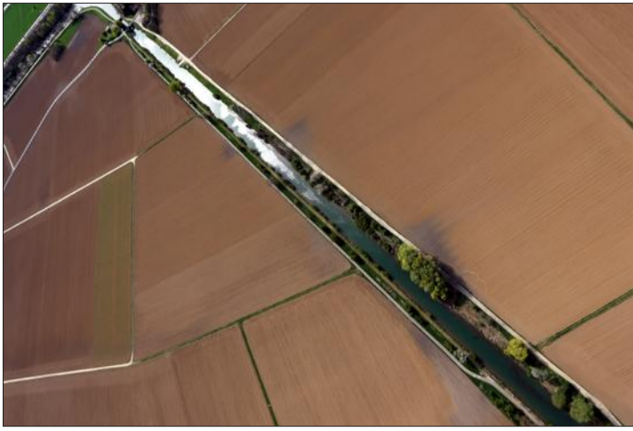
Le canal de Colmar sur les terres agricoles de Horbourg-Wihr.